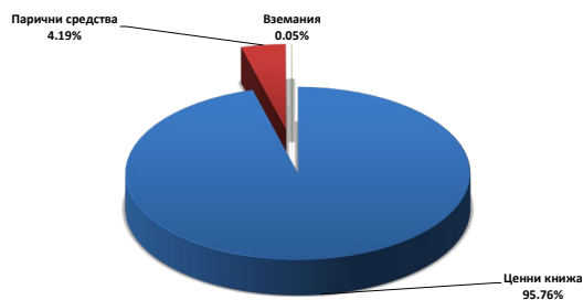
Разпределение на активите към 31/12/2023 г. като процент от активите

Очакванията ни се превърнаха в реалност като инфлацията се забави в Европа и САЩ. В края на 2023, ФЕД заговори за намаляване на лихвите по ипотечните кредити. Също така очакваме доброто представяне на фонда да продължи и следващите няколко години.